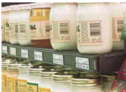
Lepení cenovkových lišt na prodejní regály (páska 9528, 9536)