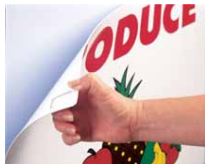
Dočasné upevnění reklamních plakátů (páska 4658)