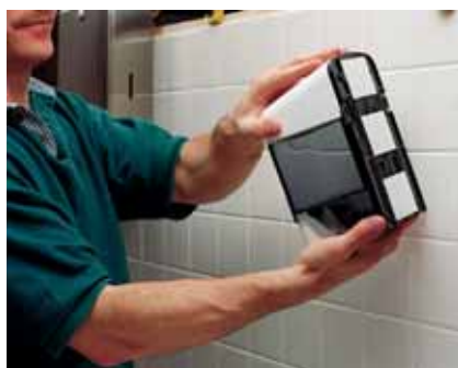
Lepení dávkovače (páska 9540)